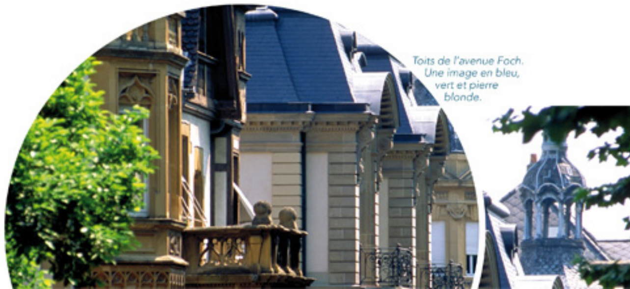
Toits de l'avenue Foch. Une image en bleu, vert et pierre blonde.

Puis il y a la ville rose avec le quartier impérial ; et on découvre également la ville blanche autour du centre Pompidou. Et, comme je le disais précédemment, par ses paysages, elle est également une ville bleue et verte !